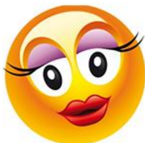
Ta holka se mi líbí!