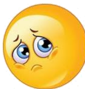
No jo, už tančí s jiným?