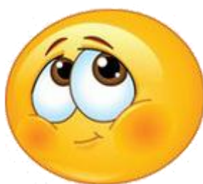
Půjdu pro ni tančit?