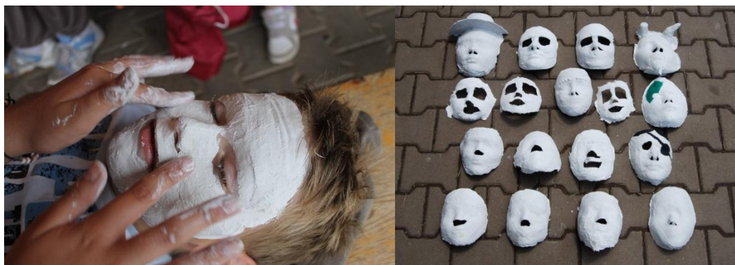
POD VERANDOU HRAJEM HRY SCHOVANÍ PŘED SLUNCEM A DĚŠTĚM NEBO BAŠTÍME